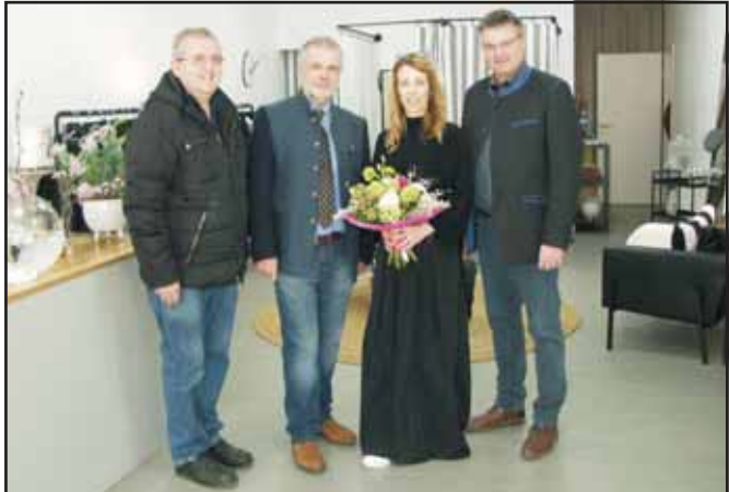
Ebreichsdorf.- Unmittelbar vor den Restriktionen im Zuge der Pandemie eröffnete Damenmode Luis, hatte aber bei Redaktionsschluß wieder geschlossen.